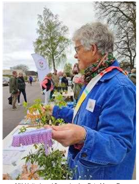
Alltid lotteri med fina priser!

på att sälja av ditt överskott av perenner, grönsaker, sommarblommor, mm! Parkering för besökare vid vattentornet. Växtlotteri med fina priser. Alla försäljare skänker 5 priser var till lotteriet. Köp en varm korv eller ta en kaffe med hembakt fikabröd i klubbhuset, prova att spela ett parti pingis och passa på och njut av vårblommorna i parken!