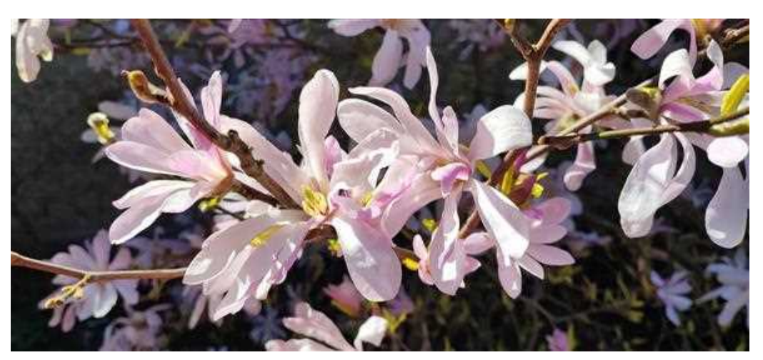
Visst blir man glad av den livliga hybridmagnolian 'Leonard Messel'!

Onsdag 24 april, kl 17 Samling i Krukmakeriets trädgård på Krukmakargränd