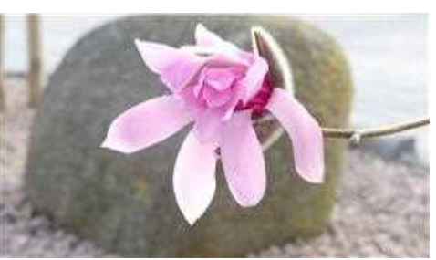
Tidigblommande Magnolia sprengeri var. diva 'Dusty Pink'.

Anmälan senast 20 april med sms till Margareta tfn: 070-496 74 94 eller mejl till garden@lts-kamelia.se