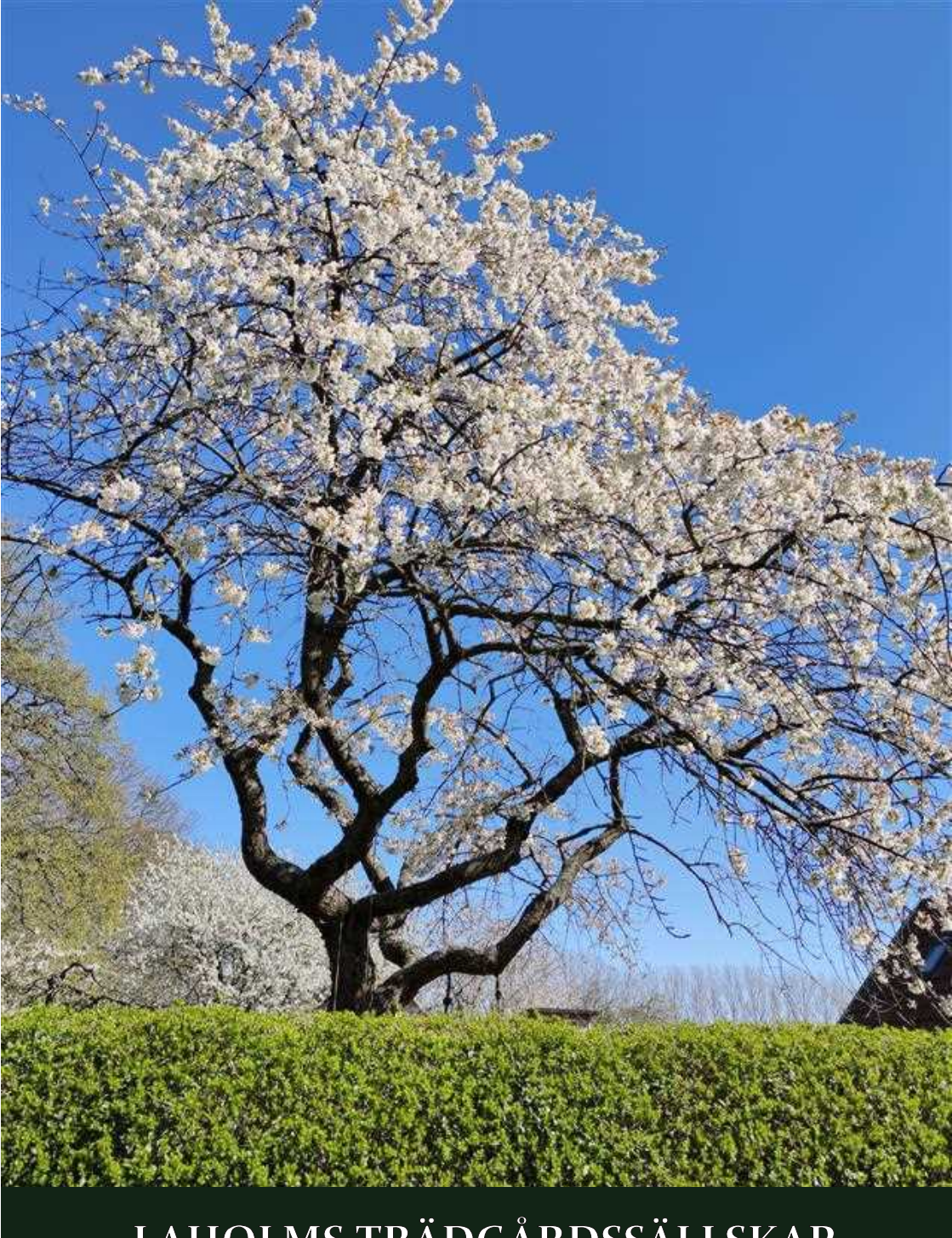
LAHOLMS TRÄDGÅRDSSÄLLSKAP Program 2024