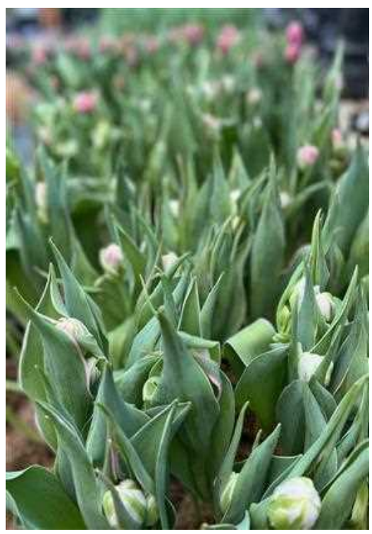
Här växer tulpaner på lök.

Vi plockar själva tulpanerna och lär oss inte enbart att använda spiralteknik när vi binder, utan också att utveckla den då blommorna har kvar sina lökar.