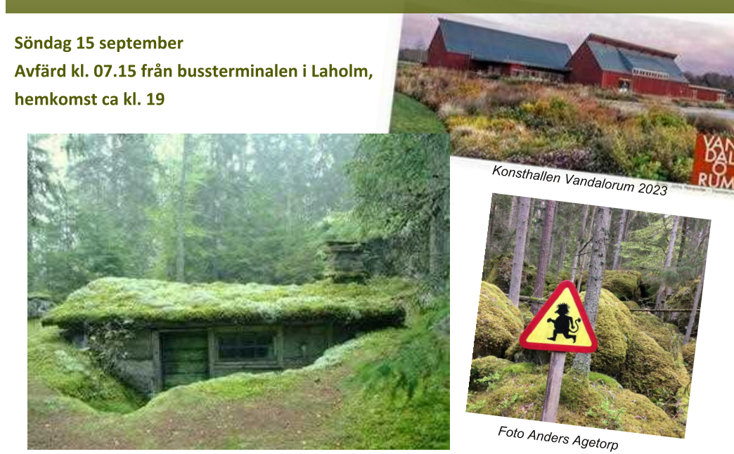
Lill-Jans backstuga i Stensjöäng